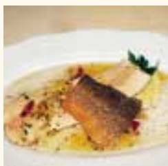
Alpenlachs mit Dialogsaft

Für den Fond nehme man je 1 klein geschnittene Zwiebel und Knoblauchzehe und schwitze sie in Olivenöl an. Hinzu kommen 30 dag geschälte Paradeiser aus der Dose samt Saft sowie Salz, Pfeffer, Zucker und Kümmel nach Geschmack. Aufgegossen wird mit einem Schuss