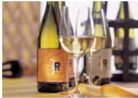
Das Weißwein-Cuvée Dialog, der zuverlässige Begleiter vieler Speisen

Dass in Zukunft noch viele weitere Weine dieser feinen Qualität angeboten werden können, dafür wird am Johanneshof Reinisch beständig Sorge getragen. Durch die Eingliederung weiterer Weingärten mit idealen Weißweimböden in die Rebflächen des Johanneshof besteht die hervorragende Möglichkeit, das Traubengut weiterer alter Rebstöcke nach rigoroser Selektierung mit einzubinden.