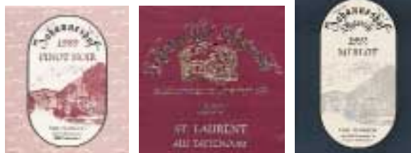
Der Lauf der Zeit im Spiegel des Etikettendesigns. Das Streben nach Dichte und Ausdruckskraft im Wein blieb die Konstante

Bitte beachten Sie dazu unbedingt die Info-Karte auf der nächsten Seite.