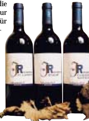
Lebendige Geschichte: Von den St. Laurent-, Cabernet Sauvignon- und Merlot-Reserven ist der Jahrgang '99 der letzte. Jetzt noch verfügbar.

Der Wein wird ab März 2003 erhältlich sein. Reservierungen werden jetzt schon gerne registriert.